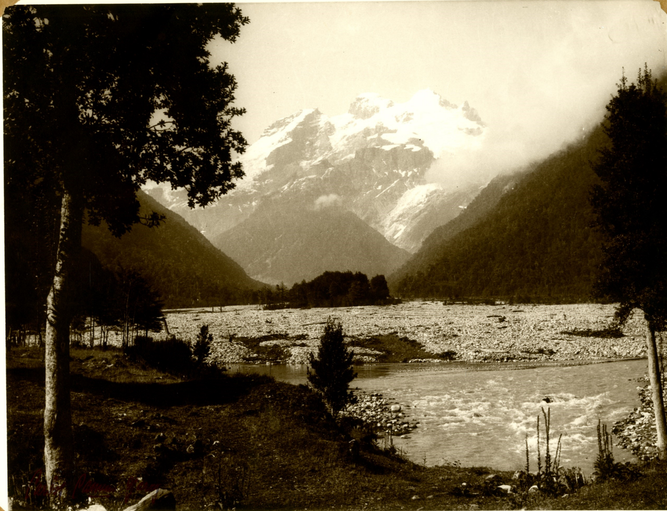
"...Majestuosa es la blanca montaña que te dió, por baluarte, el Señor..." (Cerro Tronador)