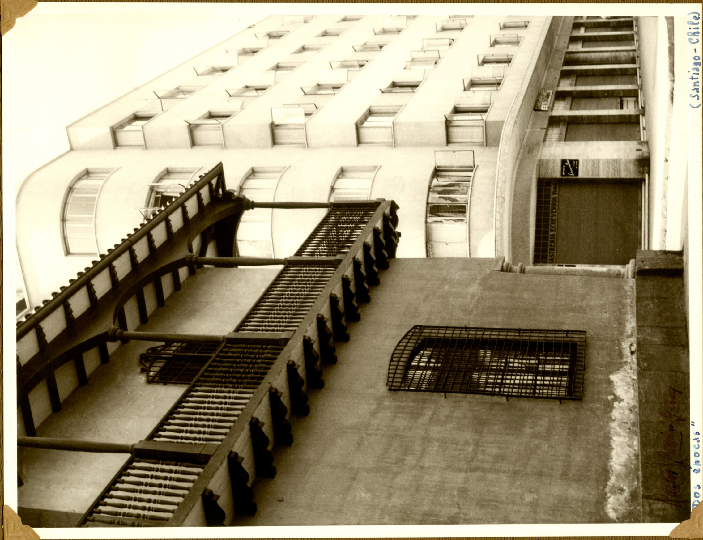
(Santiago - Chile)