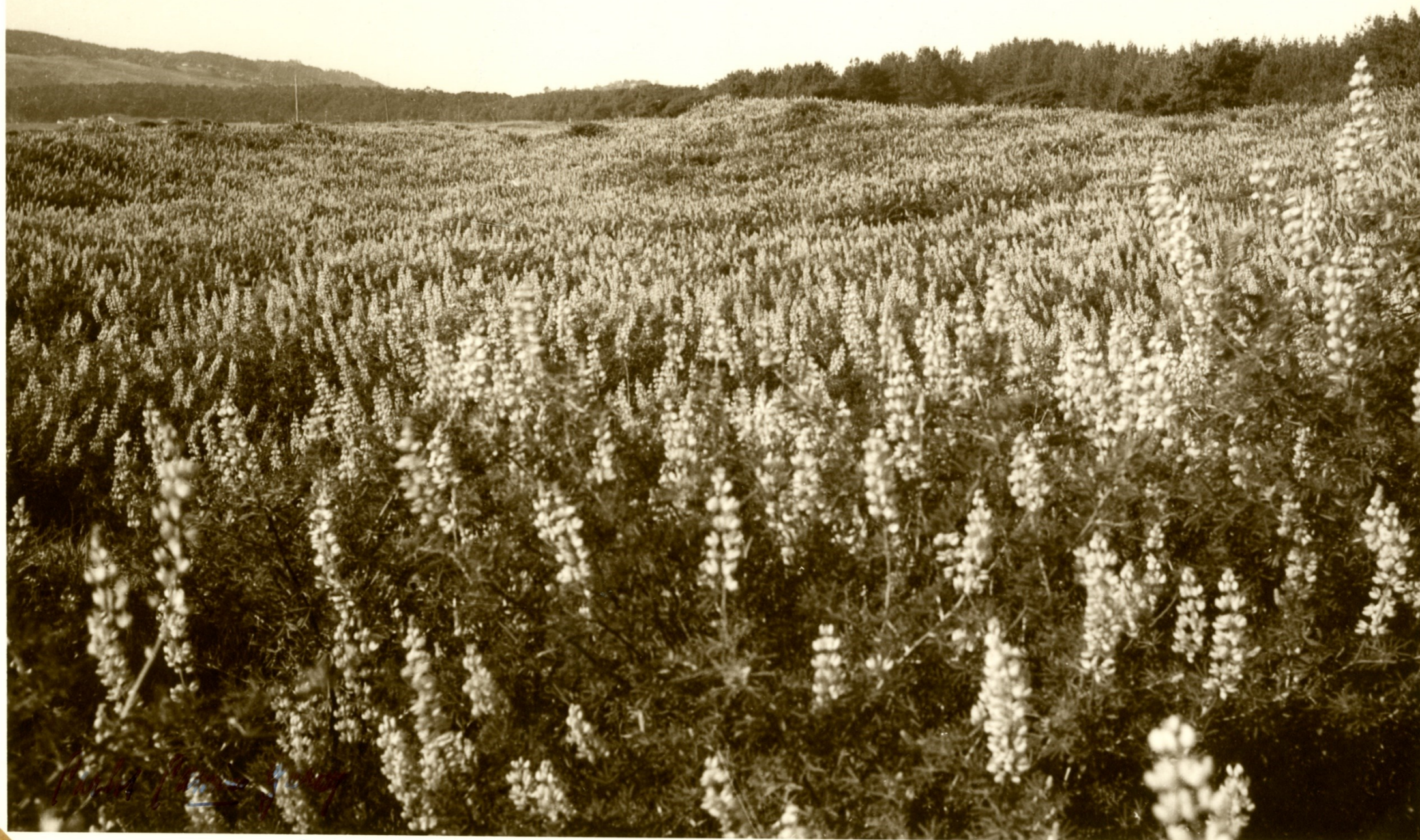
"...Y tu campo, de flores bordado, es la copia feliz del Edén..." (San Vicente-Concepción)