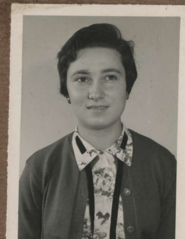
G. Sola F.