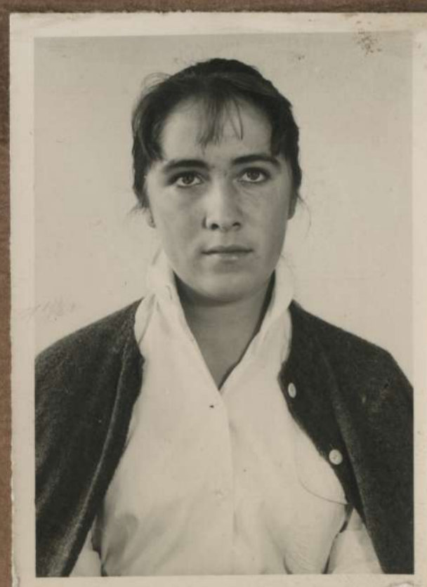
V. Jde D.