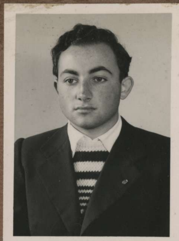
B. Presser G.